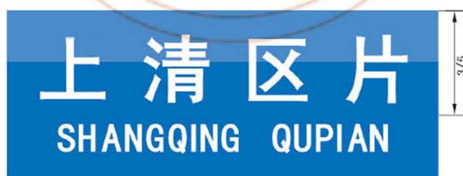
图 B.13 区片地名标志版面示例