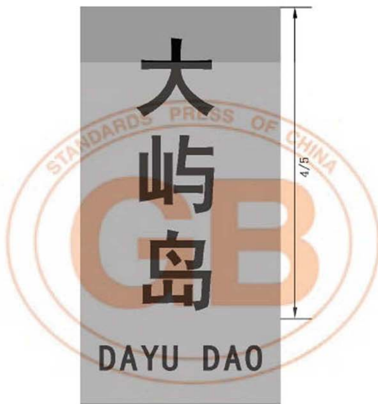
图 B.20 竖置的碑碣式地名标志版面示例