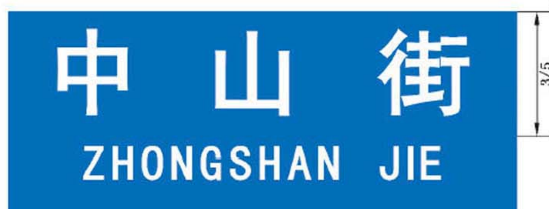
图 B.11 街地名标志版面示例