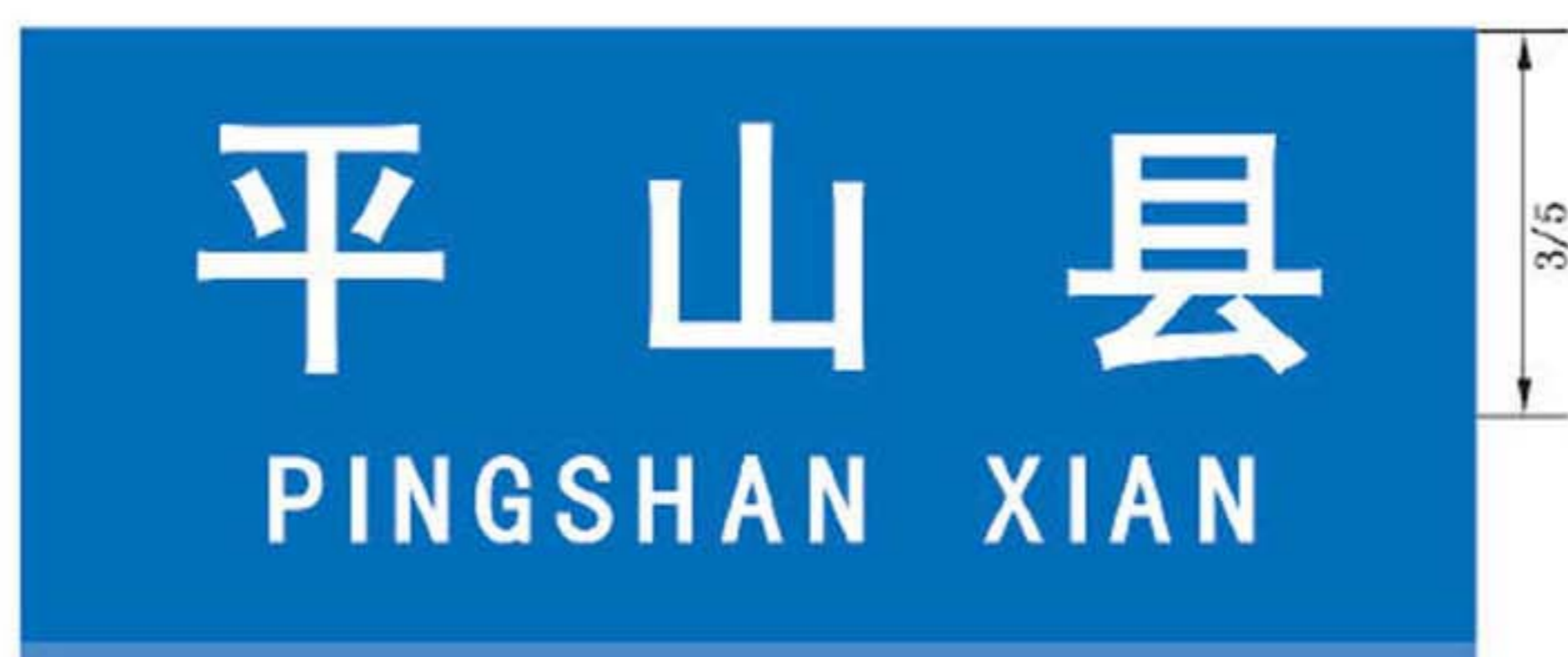
图 B.6 县级地名标志版面示例