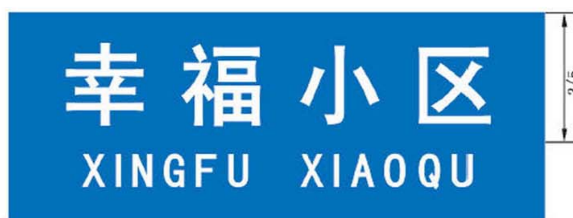
图 B.14 小区地名标志版面示例