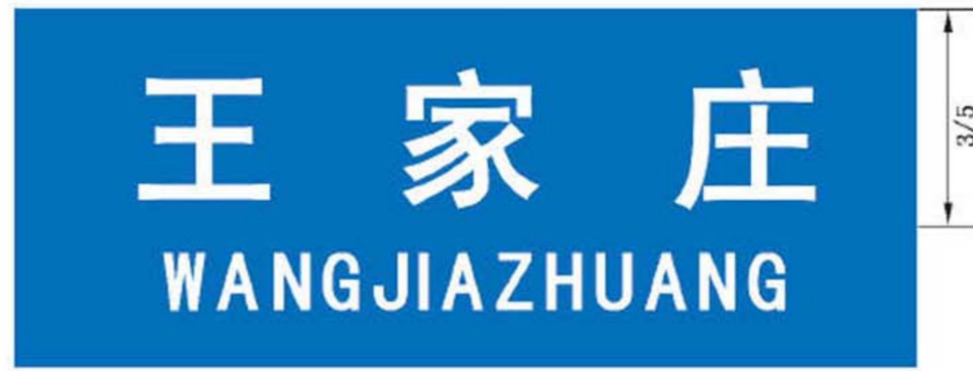
图 B. 15 村地名标志版面示例