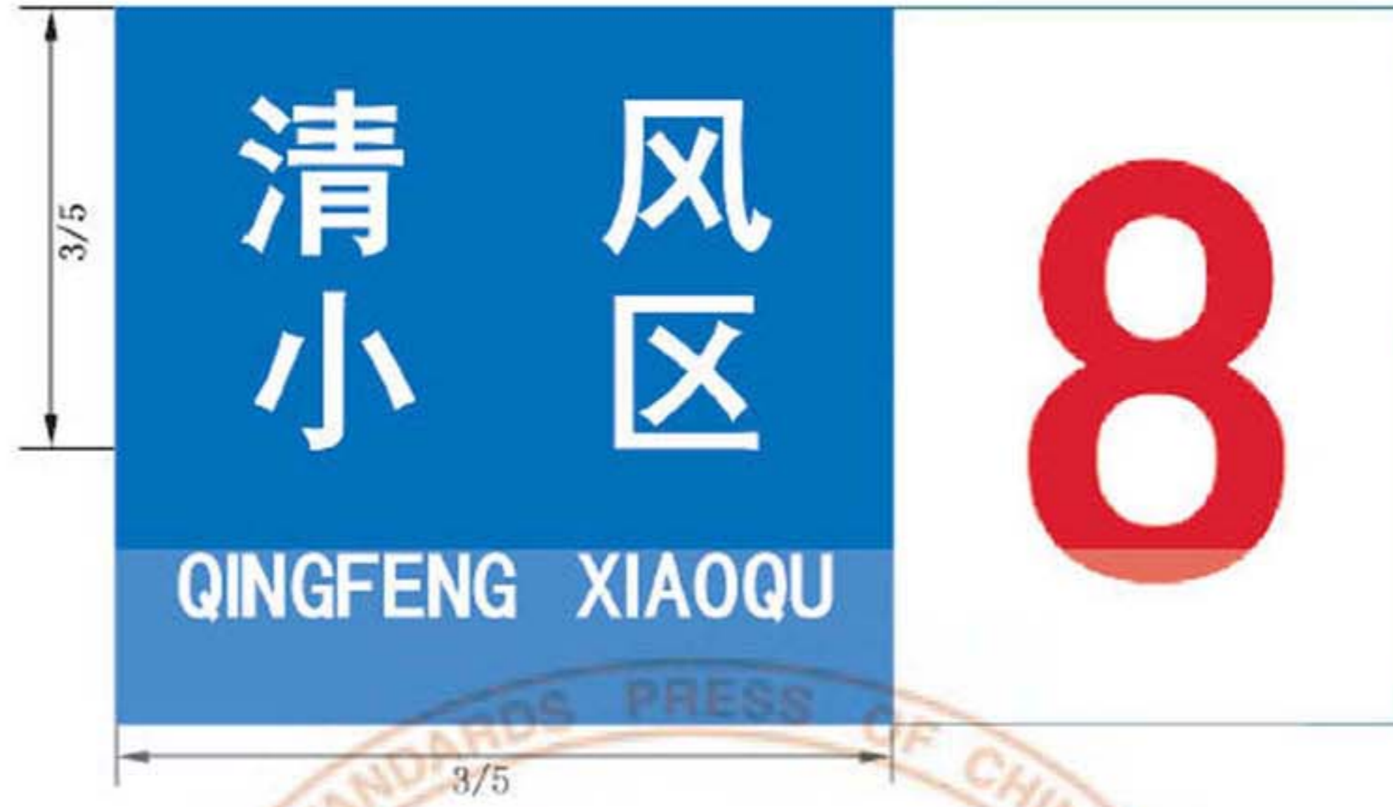
图 B. 16 楼地名标志版面示例