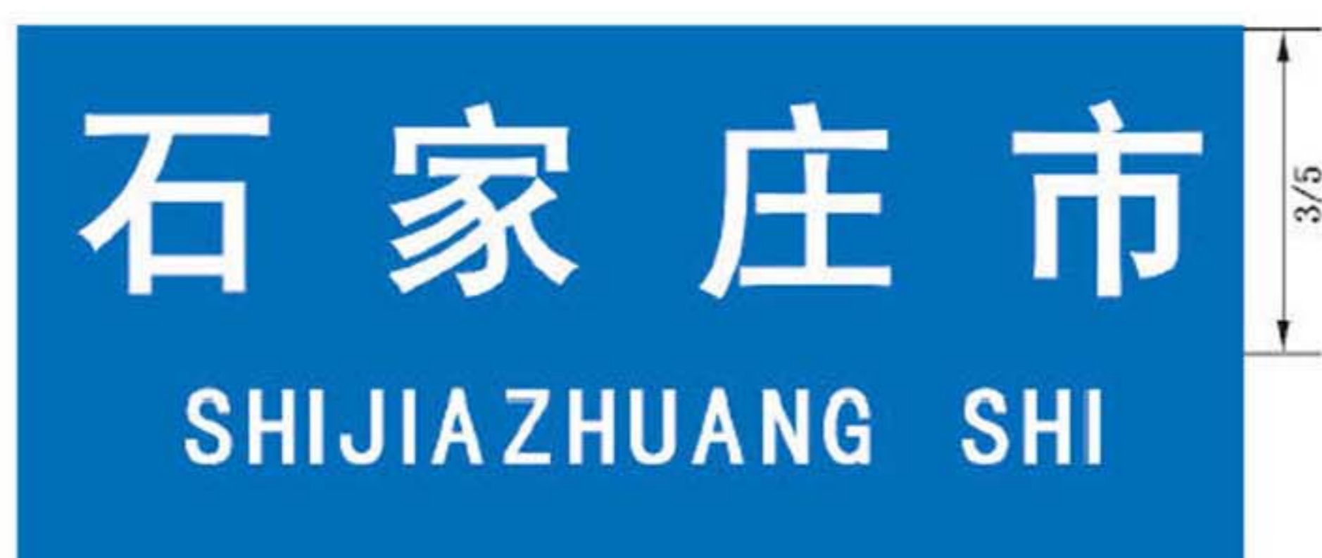
图 B.5 地级地名标志版面示例