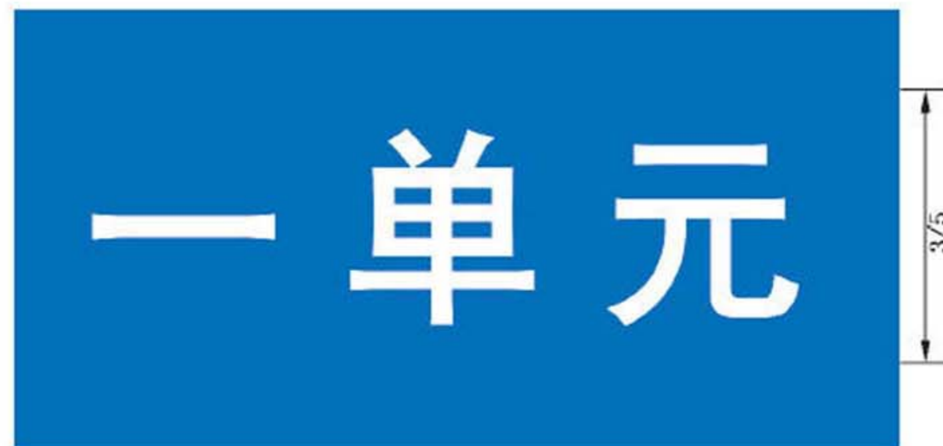
图 B. 18 楼单元地名标志版面示例