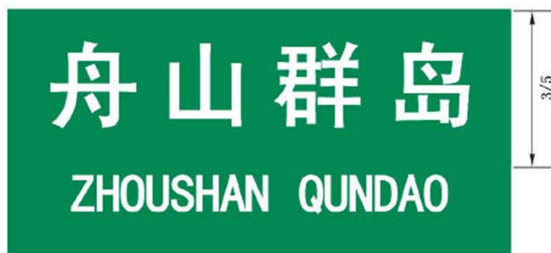
图 B.1 海域地名标志版面示例