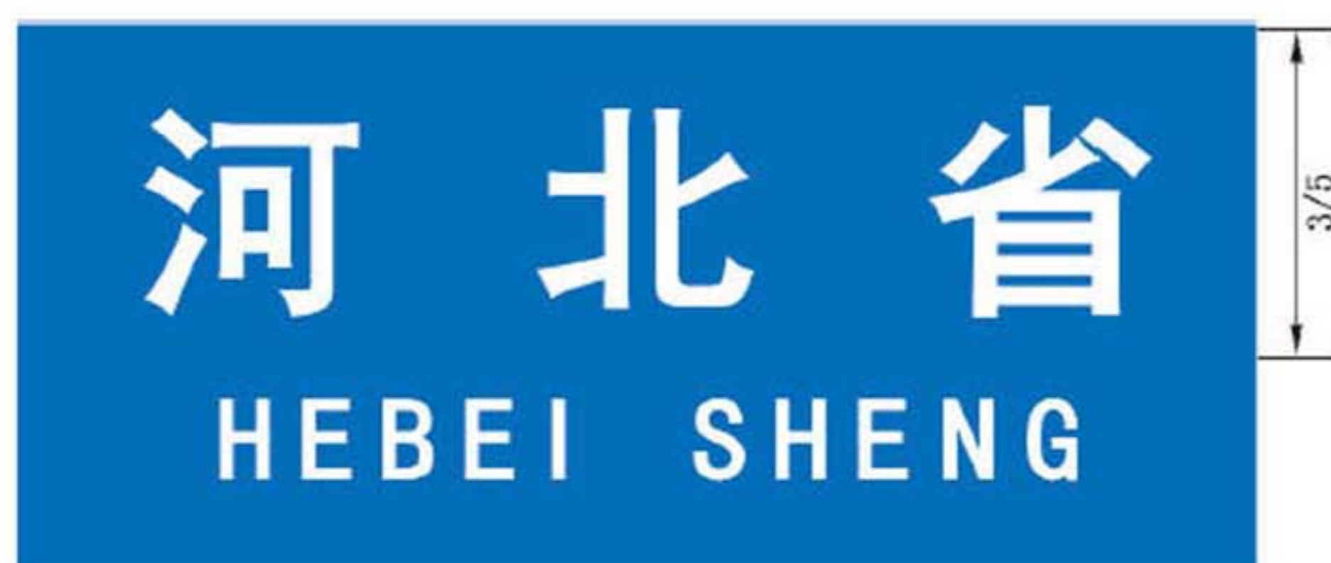
图 B.4 省级地名标志版面示例