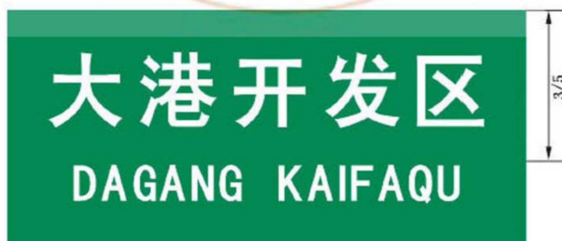
图 B.8 专业区地名标志版面示例