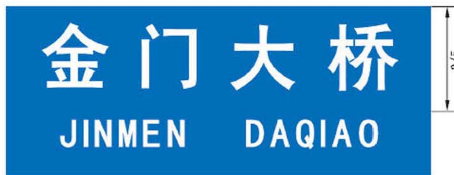
图 B.9 设施地名标志版面示例