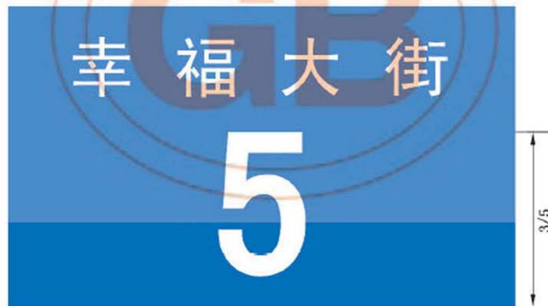
图 B. 17 门地名标志版面示例