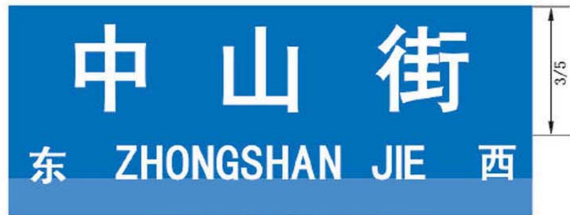
图 B.23 带有指示方向信息的地名标志版面示例