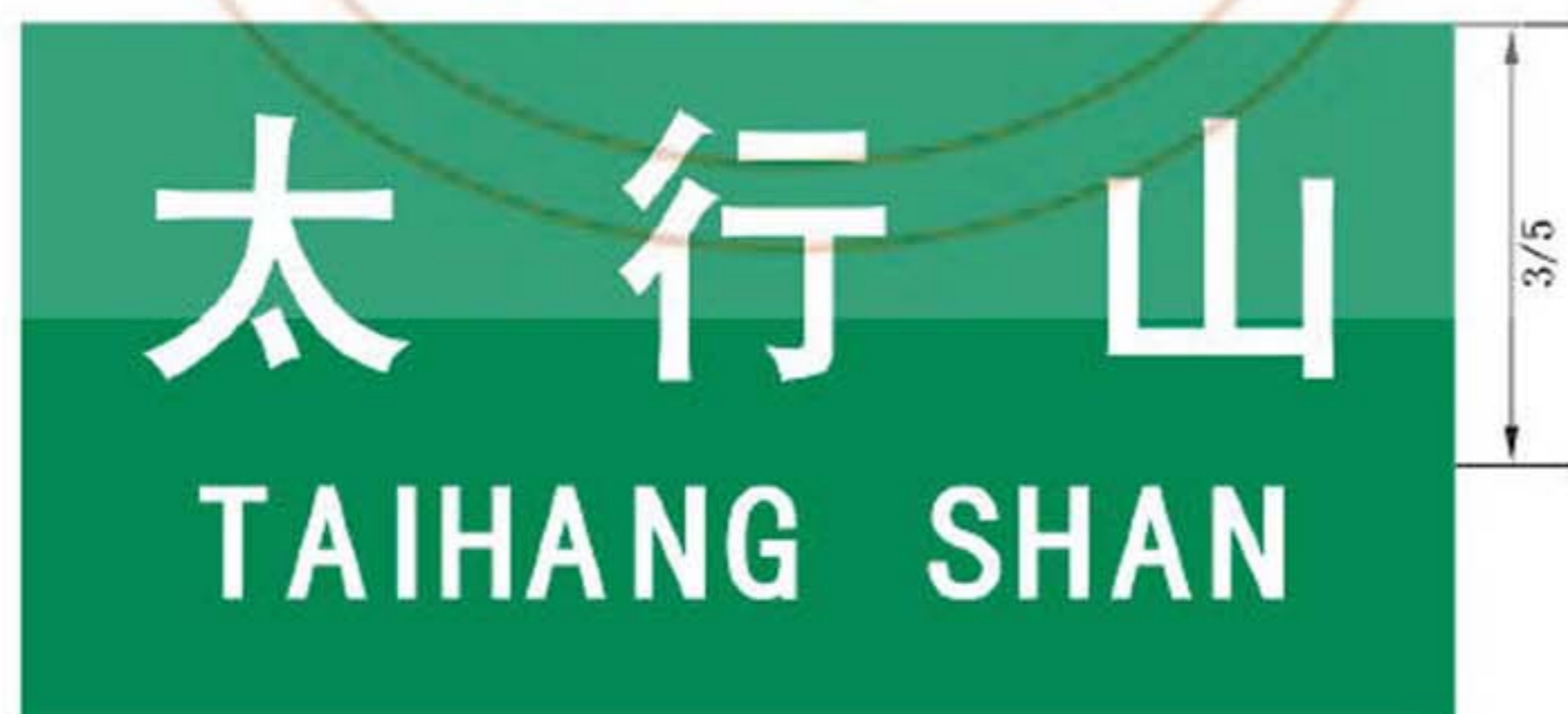
图 B.3 地形地名标志版面示例