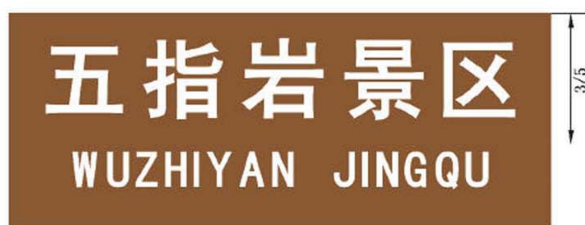
图 B.10 纪念地和旅游地地名标志版面示例