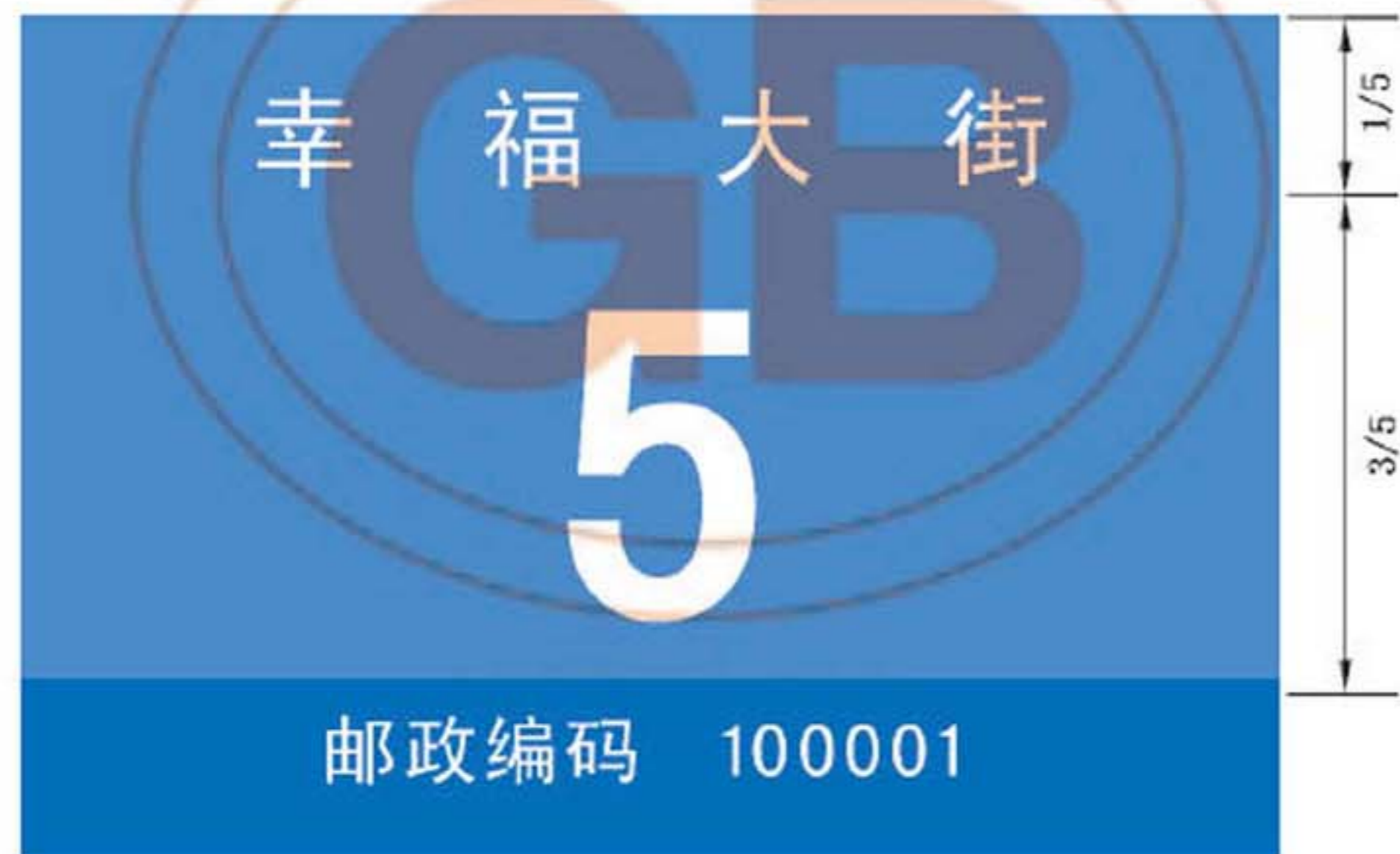
图 B.24 带有邮政编码的地名标志版面示例