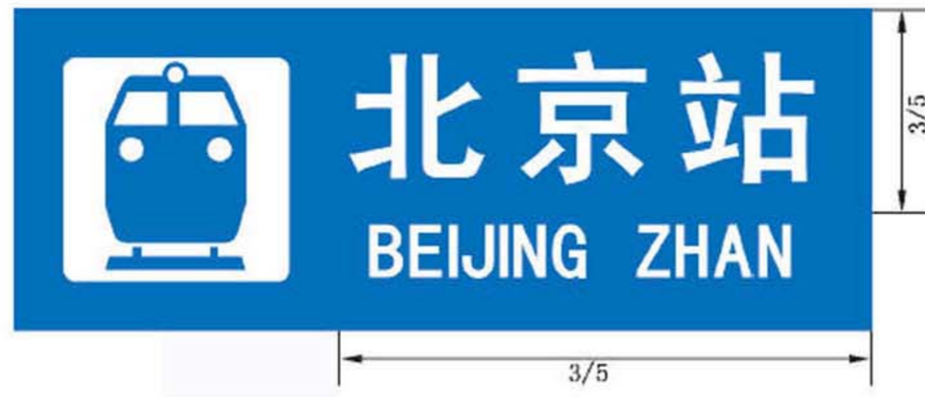
图 B.22 带有图形符号的地名标志版面示例